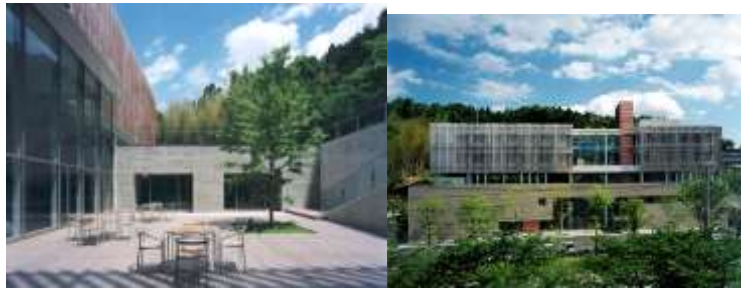
شکل ۸ و ۹: مرکز تساوی حقوق زن و مرد

ساختمان در موقعیتی قرار دارد که توسط چهار باغ احاطه شده است. این باغ ها شبیه چهار باغ ایران است. این نوع دیدگاه در ایران، آسیای میانه و جنوب آسیا بسیار طراحی شده است. این باغ ها پر از گیاهان سبز و درختان متنوعی است. که از اتاق میانی در شرق قابل مشاهده است. از طریق باغها از طریق عینک های بزرگ نور در ساختمان پدیدار می شود.