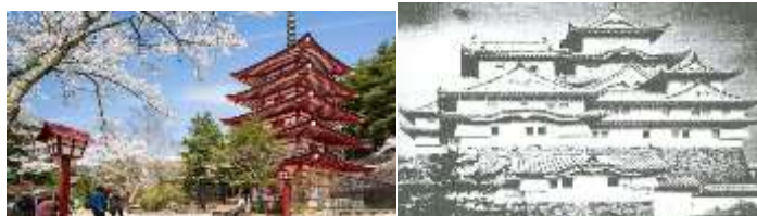
شکل ۱ و ۲. معماری قدیم ژاپنی

ژاپنی‌ها که در متمدن ساختن خویش نقشی فعال داشته‌اند، همه چیز را از غربال ذهنیت ژاپنی می‌گذرانده‌اند. ژاپن به عنوان یک تمدن شرقی به طور طبیعی وارد دوران تجدد (مدرنیته) شده است بدون این که از سنت هایش بریده باشد. سنت های پویای ژاپن مبتنی بر یک فرهنگ با ساختار ترکیبی و متکی بر بینشی کل نگر و وحدت گرا است. هنر ژاپنی در دوران تجدد از سنت خود منقطع نشده است، بلکه به صورتی پویا همواره از درون نو می‌شود و جریان و سیلان خود را در زمان ادامه می‌دهد.