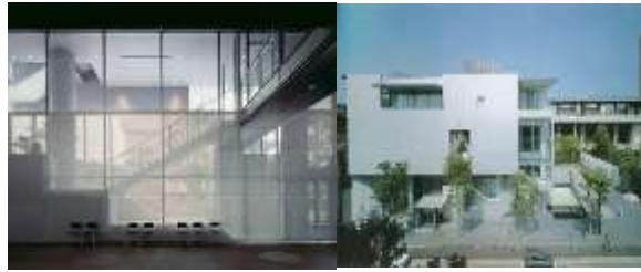
شکل ۵ و ۴. پاویون نمایشگاهی تپیا Tepia

این پاویون در سال ۱۹۸۹ توسط ماکی در شهر میناتو در توکیو طراحی و اجرا شد. در این بنا صفحات سنتی ژاپنی به نام شوچی به نحو جدیدی از نوعی فلز بسیار نازک و براق که دیدی محو را به داخل ایجاد می نماید، به کار رفته است. در اینجا مفهوم سنتی ژاپنی درباره فضای محجبه را بررسی می کند. (rendon, I. ۲۰۰۵).