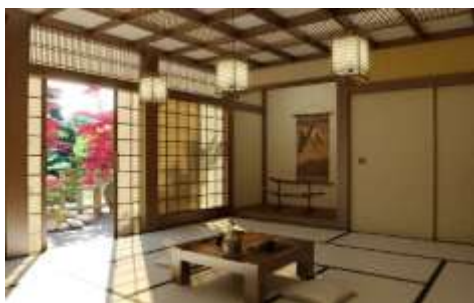
شکل ۳. استفاده از مصالح و رنگ در معماری داخلی ژاپن www.paydarag.com

در این گرایش حفظ چارچوب کلی و نمادهای ویژه شکلی معماری سنتی مورد توجه است، اما تفسیر جدید از الگوهای قدیمی با استفاده از کاربرد نسبتاً آزادانه مصالح و رنگ مشاهده می شود. در این مورد می توان به ساختمان شهرداری ناگو در اوکیناوا Okinawa کار گروه زو Team Zoo در ۱۹۸۲ اشاره کرد. این شیوه معماری در ژاپن در دهه ۱۹۶۰ با هدف بازیابی هویت و بازگشت به سنت معمول شد و بسیاری از معماران معروف ژاپنی با الگو برداری از شکل عناصر معماری سنتی ژاپن و اجرای آن با مصالح جدید با نوعی از نمادگرایی ساده شکلی سعی در ابداع شیوه ای مدرن با ویژگیهای ژاپنی داشتند.