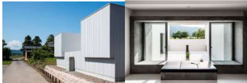
شکل ۱۰ و ۱۱. ساختمان استودیوی معماری اثر کوئیچی کیمورا منبع: www.archilovers.com

کوئیچی کیمورا، متولد کوساتسو، شهری در قلب ژاپن، می توان نمونه ای شگفت انگیز از معماری معاصر را پیدا کرد که در استان شیگا در منطقه کینکی جزیره هونشو واقع شده است. ساختمان مورد بحث از نزدیک از فلسفه استودیوی معماری او پیروی می کند، که هدف آن آمیختن مینیمالیسم امروزی با سنت ها و صنعت هزار ساله ژاپن است. نتیجه یک تمرین استادانه و معتبر در معماری معاصر است که به طور منحصر به فرد و قابل توجهی خارج از معمول است.