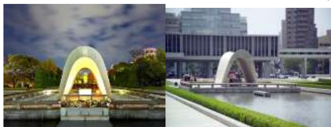
شکل ۱۲ و ۱۳. المان یادبود در مرکز صلح هیروشوما www.gpsmycity.com/tours/hiroshima-peace-memorial-tour-۳۹۴۲.html

ساخت ساختمان‌های بزرگ را با رشد بیولوژیکی ارگانیک ادغام می‌کرد) بلکه به عنوان نمونه‌ای از بازسازی غربی که ژاپن پس از جنگ با آن مواجه شد (جاسمی، عبدالله، ۱۴۰۱) تاریخی سازی و عظمت جزمی تانگه می‌تواند با طرح‌های یادمان غیرتاریخی، اسرار آمیز و بسیار حس برانگیز تا کاماتسو مقایسه کرد. هر دو در حالی که عمیقا از ناامیدی شرایط شهری که به تصویر کشیده اند خسته اند با وجود این قصد دارند با آن ستیز کنند، اما در واقع به نظر می‌رسد که هردوشان از همین شرایط هم بهره بگیرند و هم به آنها کمک کنند، کارهای او در برگزیده زیبایی شناختی یادمانی از برخی الگوهای اسرار آمیز، به دقت ساخته شده و مکانیکی بیش از بزرگ یا اشیاء تشریفاتی را در برمی گیرد که اوج نهایی بیان شان تلاش در علبه و فراتر رفتن از هر چیز اطراف خود دارند که به معنای جبران ناممکنی آینده معماری در شهرهم هست. اگرچه همواره از تانگه به عنوان پدر معماری مدرنیسم ژاپن یاد می‌کنند اما خود او بارها به مقوله‌ی استفاده از مفاهیم معماری سنتی ژاپنی در کارهای خود اشاره کرده است. همچنین کارهای اولیه‌ی او نظیر بنای یادبود هیروشما در مرکز صلح هیروشوما و دفتر فرمانداری کاگاوا که باز آفرینی بتنی از فرمهای سنتی معماری ژاپنی هستند. پروژه‌های کوچکتر و فردی کنزو تانگه بازتاب بازگشت او به زیبایی شناسی جنبش مدرن متاخر است، همانطور که در ساختمان انجمن هنرهای زیبای مینیاپولیس، مینه سوتا (۱۹۷۴)، ساختمان هانای موی در توکیو (۱۹۷۸) و شاهزاده آکاساکا دیده می‌شود. هتل، توکیو (۱۹۸۲) علاقه کنزو تانگه به سنت‌های قدیمی ژاپنی است که بسیاری از اصول زیبایی‌شناختی او ریشه در آن دارند